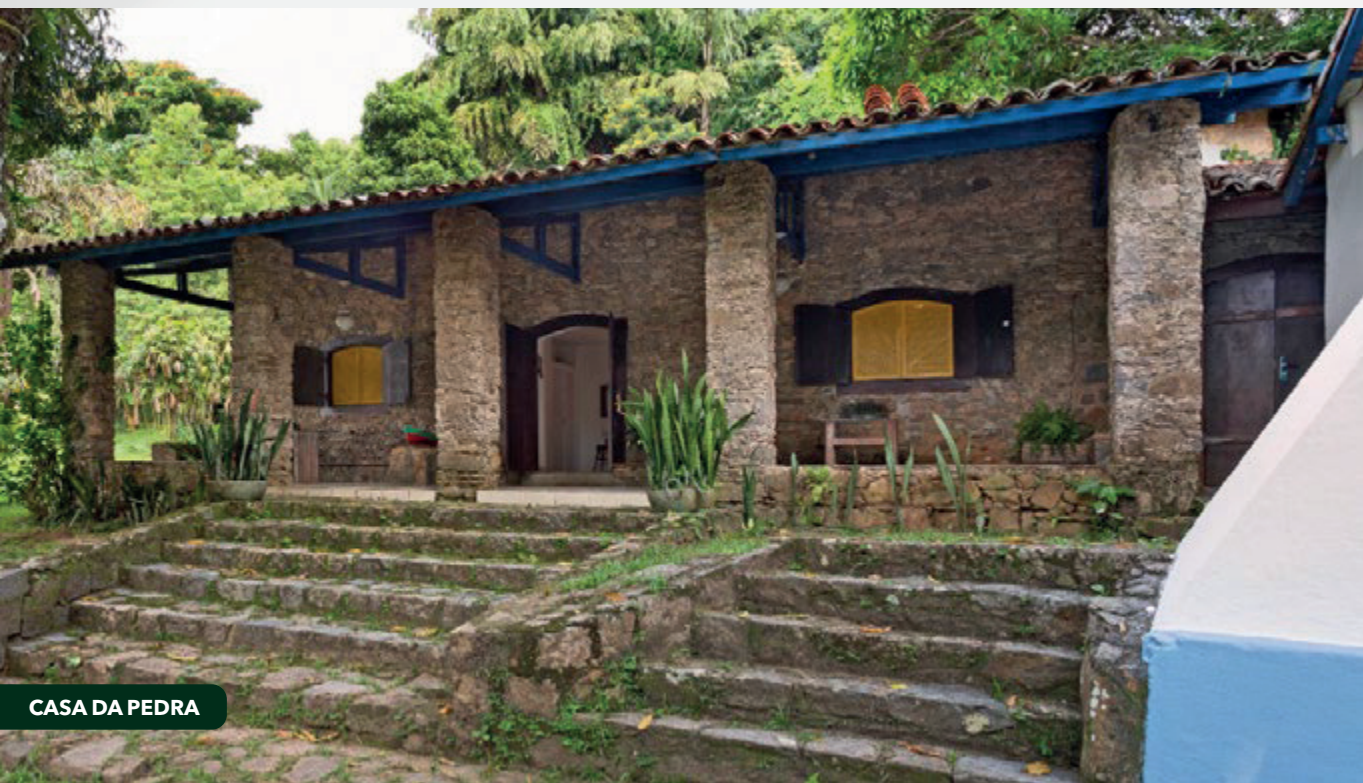
CASA DA PEDRA

Já a Casa da Pedra reproduz na Vila a paisagem da comuna francesa Carcassonne, de onde Walt Disney tirou inspiração para o castelo de "A Bela Adormecida".